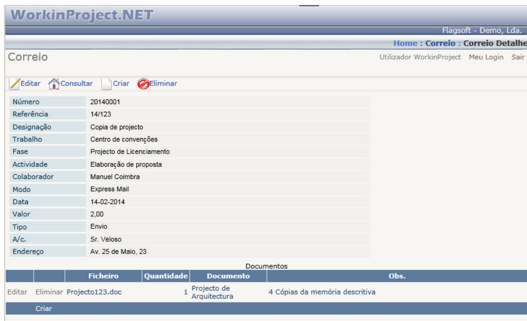
Dados do envio/recepção de documentos.